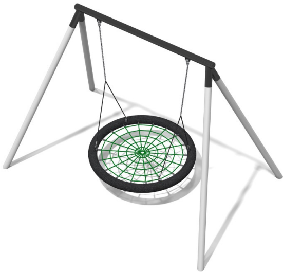
Huśtawka bocianie gniazdo