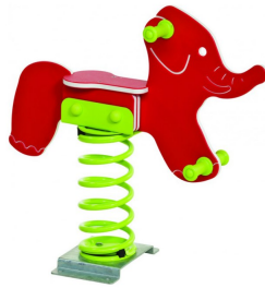
Bujak na sprężynie

długość ławki: 204 cm wysokość całkowita ławki: 77cm wysokość siedziska: 43cm głębokość siedziska: 40cm głębokość całkowita ławki: 70cm materiał ławki: rura Ø 60,3mm – stal ocynkowana i malowana RAL 7016 listwy: drzewo iglaste kolor palisander ilość listew: 9 rozmiar listew: 180x9x3,7cm konstrukcja: rura stalowa materiał listew (siedzisko,oparcie): drewno podłokietniki: tak mocowanie: do przykręcenia